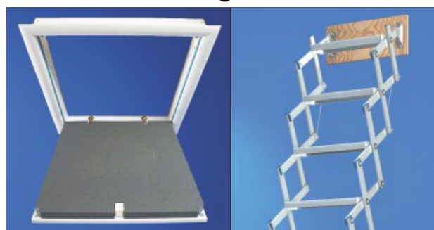
Deckentüre, Scherentreppe mit Stirnbrett